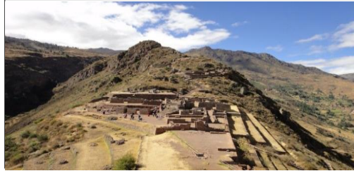
Acondicionamiento Turístico Pisac