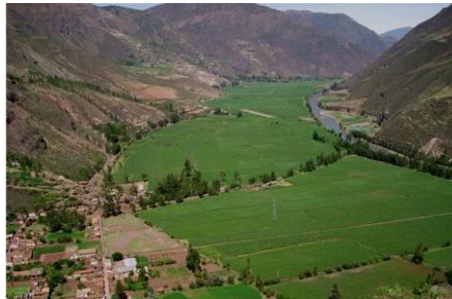
Valle Sagrado de los Incas