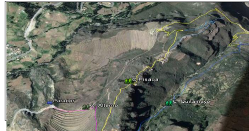
Foto Mejoramiento del acceso vehicular al C.A. Pisac