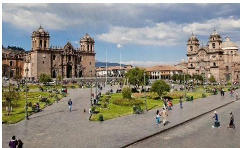
Plan de movilidad orientado al peatón