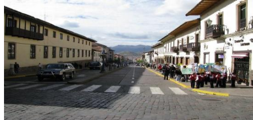
Seguridad Vial en el centro histórico v