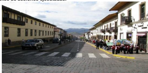
Seguridad Vial en el centro historico v