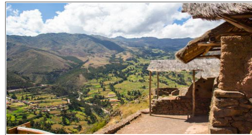
Foto Mejoramiento del acceso vehicular al C.A. Pisac

Acondicionamiento e implementación de mirador, estacionamiento y señalización en el Mirador de Corao Acondicionamiento e implementación de mirador, estacionamiento y señalización en el Mirador de Pisac Acondicionamiento e implementación de mirador, estacionamiento y señalización en el Mirador de Racchi Acciones de sensibilización con involucrados Acciones de promoción y difusión