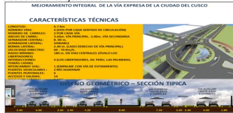
Longitud total de vía Expresa en la ciudad

Mejoramiento integral de la Vía Expresa, en el tramo Ovalo Los Libertadores, Nodo Versalles, con 6,7 Km. de longitud y 04 vías de 02 carriles cada uno comprende 02 puentes 01 paso a nivel deprimido y 01 viaducto; puentes peatonales, calzadas de asfalto, veredas de concreto.