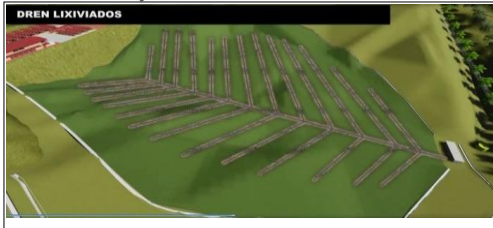
Video - material de socialización