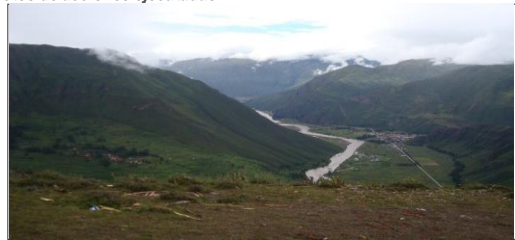
Acondicionamiento Turístico Pisac

A.2 SUPERVISOR Nro. Asientos de Supervisión en el mes informado: