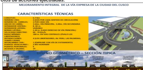
Longitud total de vía Expresa en la ciudad

Mejoramiento integral de la Vía Expresa, en el tramo Ovalo Los Libertadores, Nodo Versalles, con 6,7 Km. de longitud y 04 vías de 02 carriles cada uno comprende 02 puentes 01 paso a nivel deprimido y 01 viaducto; puentes peatonales, calzadas de asfalto, veredas de concreto.