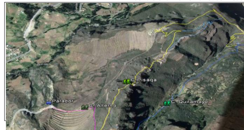
Foto Mejoramiento del acceso vehicular al C.A. Písaq