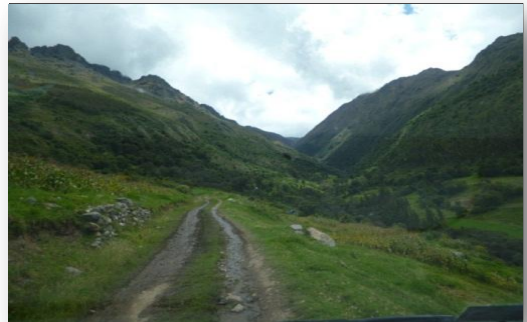
Foto Mejoramiento del acceso vehicular al C.A. Písaq