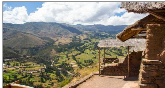
Foto Mejoramiento del acceso vehicular al C.A. Pisac