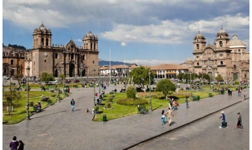
Plan de movilidad orientado al peatón