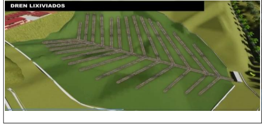
Video - material de socialización