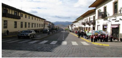
Seguridad Vial en el centro historico v