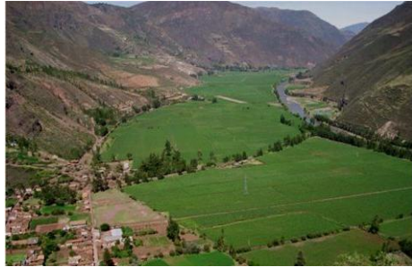
Valle Sagrado de los Incas

La Unidad Ejecutora del Programa (UEP) es una Unidad Ejecutora del Pliego Presupuestal del Gobierno Regional del Cusco, es decir el PER Plan COPESCO, responsable de conducir y coordinar la implementación y administración del Programa de Inversión "Consolidación y diversificación del producto turístico Cusco - Valle Sagrado de los Incas entre las provincias de Cusco, Calca y Urubamba de la Región del Cusco", para lo cual cuenta con la autonomía técnica y financiera.