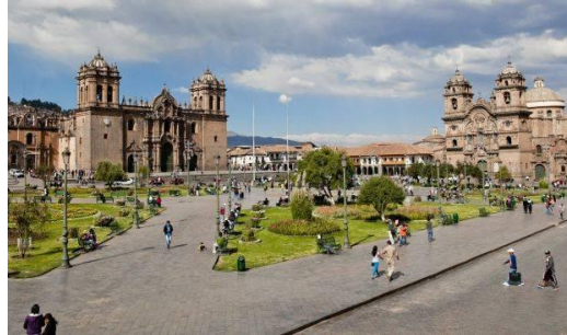
Plan de movilidad orientado al peaton