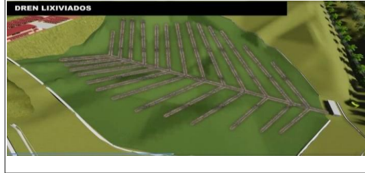
Video - material de socialización