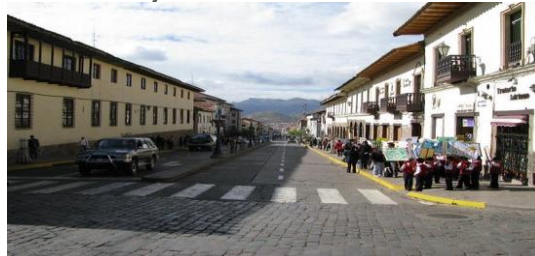
Seguridad Vial en el centro historico v