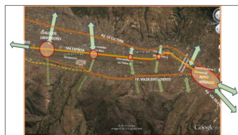
Sección de vía expresa: anteproyecto del Estudio de Factibilidad

Mejoramiento integral de la Vía Expresa, en el tramo Ovalo Los Libertadores, Nodo Versalles, con 6,7 Km. de longitud y 04 vías de 02 carriles cada uno comprende 02 puentes 01 paso a nivel deprimido y 01 viaducto; puentes peatonales, calzadas de asfalto, veredas de concreto.