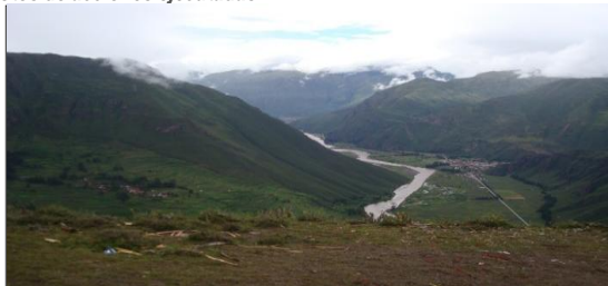
Acondicionamiento Turístico Pisac