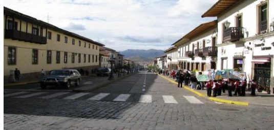
Seguridad Vial en el centro historico v

Código SNIP : PROG-016-2013-SNIP Prod/Proy : 2309562 Unidad Ejecutora : PER PLAN COPESCO Meta SIAF del 2017 : 00013 Meta Fisica (resumen) : Descripción de los Componentes del Proyecto;