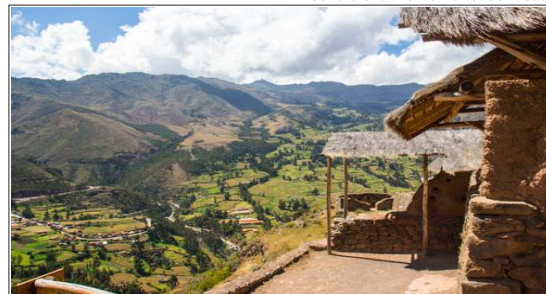
Foto Mejoramiento del acceso vehicular al C.A. Pisac