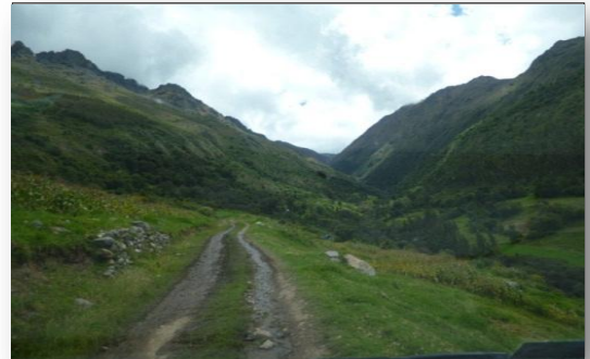
Foto Mejoramiento del acceso vehicular al C.A. Písaq