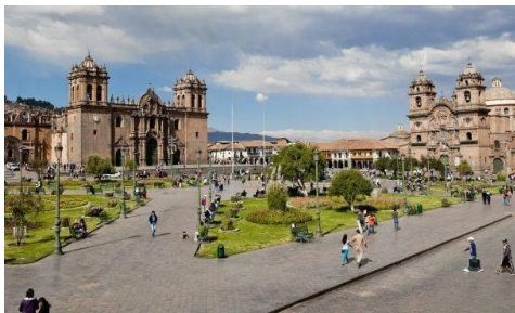
Seguridad Vial en el centro historico

El objetivo de este componente es de fortalecer la capacidad de gestión e implementado el Plan Regulador del Transporte Público en la ciudad de Cusco. Fomentado el uso de bicicletas en la ciudad de Cusco.