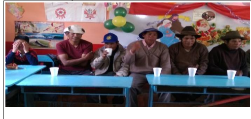
Viaje de Pasantía

A.3 DATOS DEL PROYECTO : Código SNIP : 235236 Prod/Proy : 2197984 Unidad Ejecutora : PER PLAN COPESCO Meta SIAF del 2,016 : 00001 Meta Física (resumen) : Descripción de los Componentes del Proyecto;