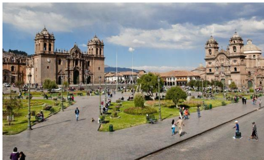
Plan de movilidad orientado al peaton

El objetivo de este componente es de fortalecer a la Gerencia de Infraestructura de la MP Cusco en temas de gestión vial, así como; fortalecer las capacidades del PROGRAMA METRA – COPESCO y de la MP Cusco.