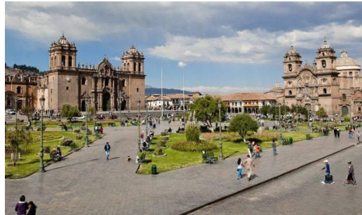
Plan de movilidad orientado al peaton