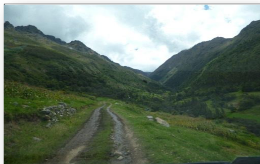
Foto Mejoramiento del acceso vehicular al C.A. Pisac