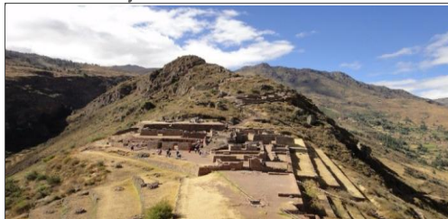
Acondicionamiento Turístico Písaq