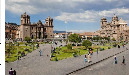
Plan de movilidad orientado al peatón