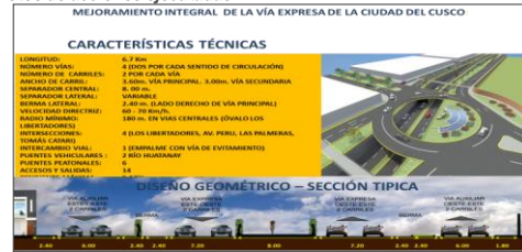
Longitud total de vía Expresa en la ciudad

Mejoramiento integral de la Vía Expresa, en el tramo Ovalo Los Libertadores, Nodo Versalles, con 6,7 Km. de longitud y 04 vías de 02 carriles cada uno comprende 02 puentes 01 paso a nivel deprimido y 01 viaducto; puentes peatonales, calzadas de asfalto, veredas de concreto.