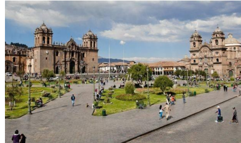
Seguridad Vial en el centro historico

El objetivo de este componente es de fortalecer la capacidad de gestión e implementado el Plan Regulador del Transporte Público en la ciudad de Cusco. Fomentado el uso de bicicletas en la ciudad de Cusco.