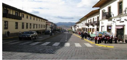
Seguridad Vial en el centro historico v